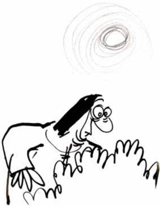
© Claire Bretécher / Dargaud La Vie passionnée de Thérèse d'Avila , 1980