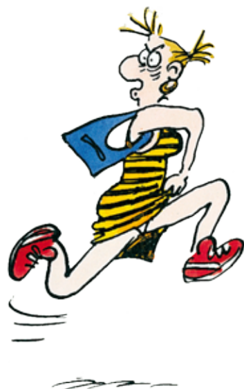
© Claire Bretécher. Agrippine, 1988

Une large programmation associée (rencontres, débats, projections, ateliers) accompagne cet événement.