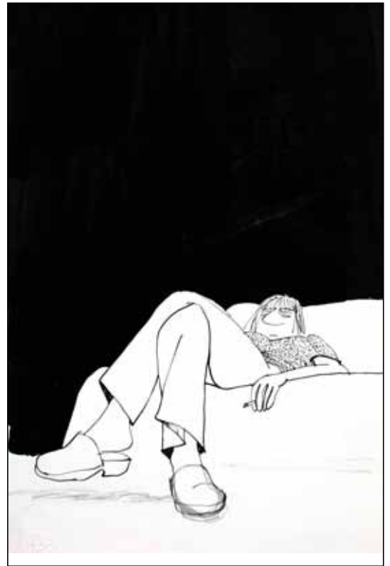
© Claire Bretécher Esquisse pour la couverture de l'album Les Frustrés , 1975