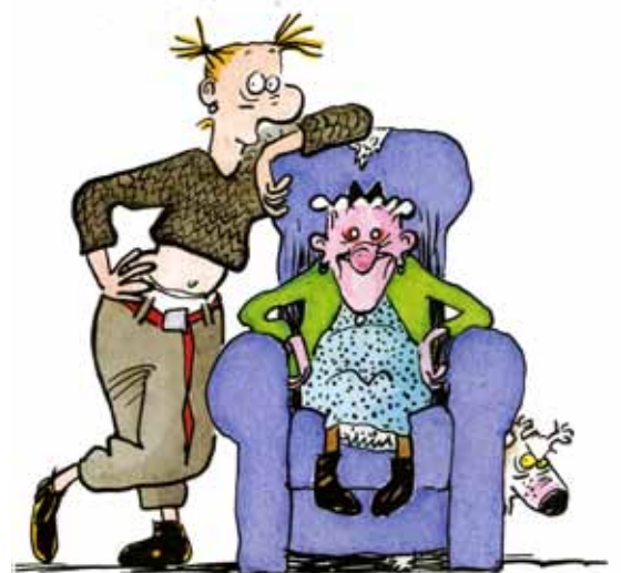
© Claire Bretécher / Dargaud Agrippine et l'ancêtre , 1998