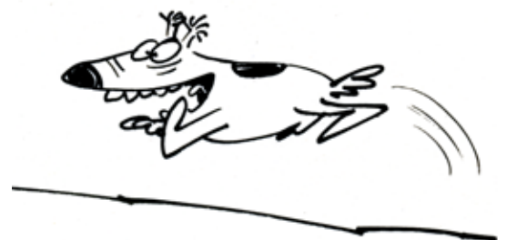
© Claire Bretécher / Dargaud Les Amours écologiques du Bolot occidental , 1977