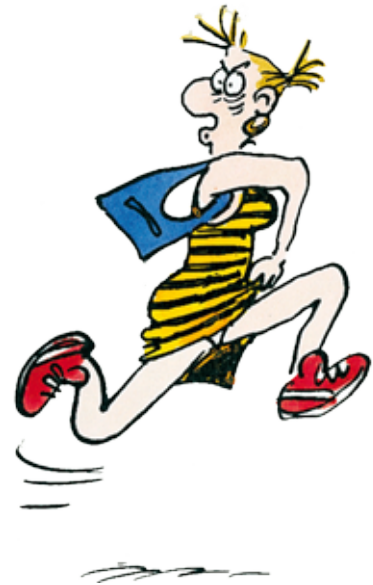
© Claire Bretécher / Dargaud Agrippine , 1988