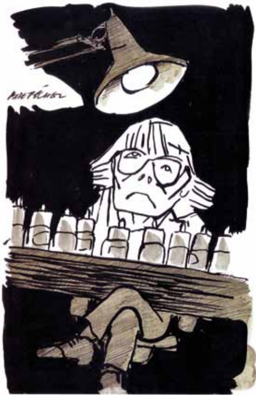
© Claire Bretécher Moments de lassitude , 1999