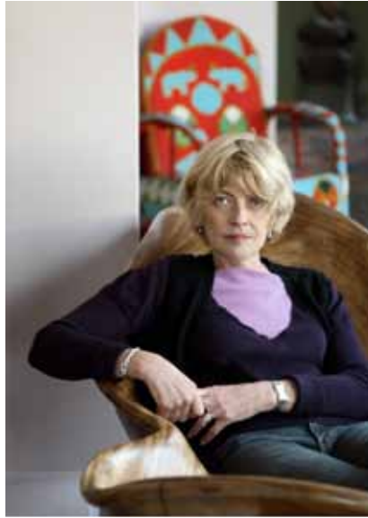
Claire Bretécher / Dargaud

Attachée de presse asc (agencesylviechabroux) Sylvie Chabroux 06 64 25 48 42 • 01 44 07 47 62 sylvie@chabroux.com