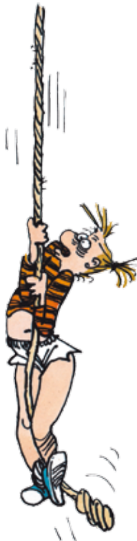
© Claire Bretécher / Dargaud Agrippine , 1988