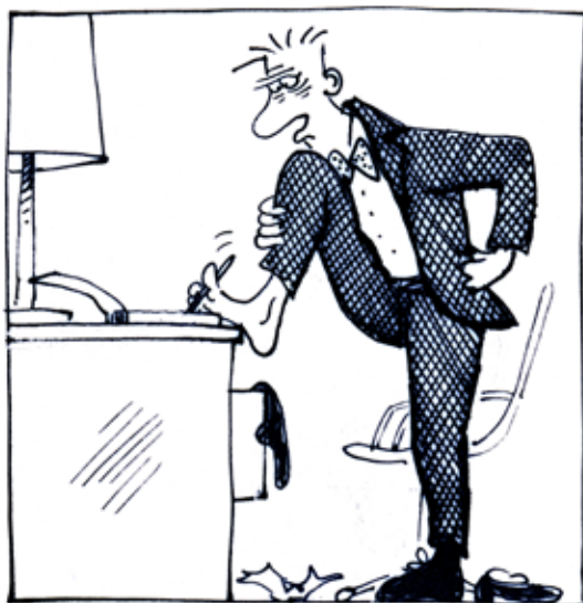
© Claire Bretécher / Dargaud Le Docteur Ventouse, bobologue , 1985