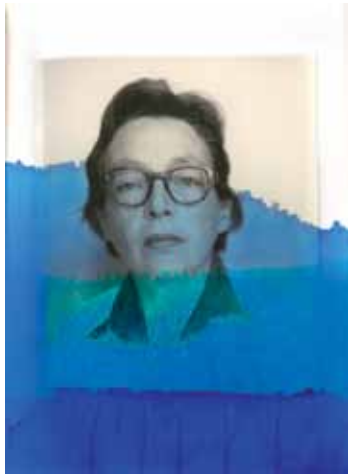
« Encre assassine », 2014 de Thu Van Tran Livre, bleu de méthylène. 26 x 42 cm (Détail) Portrait de Marguerite Duras issu de la collection Jean Mascolo

Bibliothèque publique d'information / Centre Pompidou 75197 Paris Cedex 04