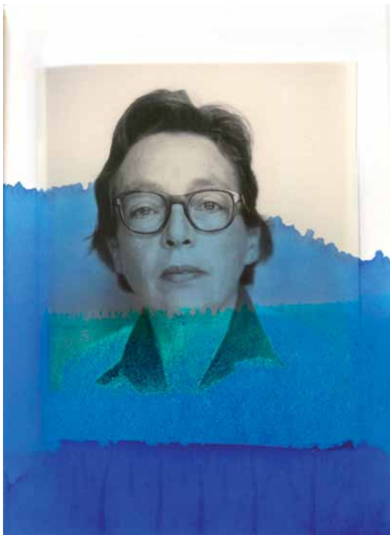
« Encre assassine », 2014 de Thu Van Tran Livre, bleu de méthylène. 26 x 42 cm (Détail) Portrait de Marguerite Duras issu de la collection Jean Mascolo

Exposition réalisée en coproduction avec l'IMEC